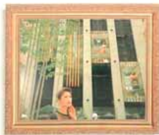
內湖路·大直國家社區 (社區住宅) 外型：後側扇型 機種：VF-15人乘×2台 3停站/3樓高 速度：C060