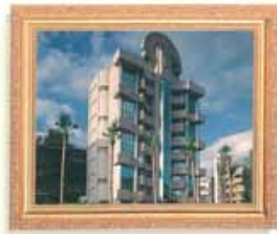
雨農路·聯高建設 (別墅住宅大樓) 外型：六角扇型 機種：VF-11人乘×1台 7停站/11樓高 速度：C090