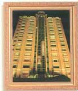
紫雲街·高林閣 (別墅住宅大樓) 外型：六角扇型 機種：VF-9人乘×2台 17停站/17樓高 速度：C090