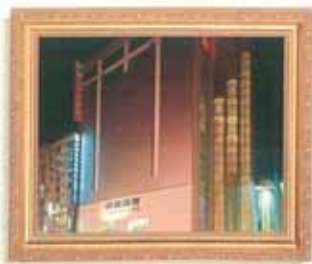
忠孝東路·明曜百貨 (百貨公司) 外型：六角扇型 機種：EC-18人乘×3台 16停站/16樓高 速度：C0105